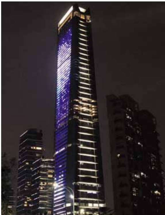
Иллюстрация 3. One Shenzhen Bay, Шэньчжэнь, КНР. Арх.: Kohn Pedersen Fox. 2018 г.