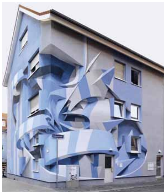
Иллюстрация 5. 3D-граффити на фасаде дома в Мангейме (ФРГ). 2019 г.

Визуальная дематериализация. Один из способов визуального «растворения» здания в пространстве — применение зеркальных фасадов, отражающих окружающую среду и эффектно сливающихся с ней. Это растворение границы между реальным и виртуальным мирами — характерный прием в искусстве перформанса. Зеркальное здание интригует, побуждает обойти его с разных сторон, улавливая визуальные эффекты дематериализации, организуя таким образом перформативные действия и переживания зрителя. Так решены фасады Фондохранилища музея Бойманса ван Бенингена в Роттердаме