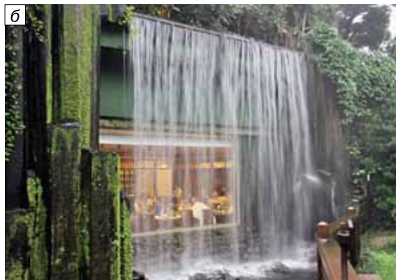
Иллюстрация 4: а — Crown Fountain в Миллениум парке, Чикаго, США. Арх.: Jaume Plensa. 2004 г. Источник: http://www.holidaytravel.cc/Article/UploadFiles/201602/2016022916240321.jpg ; б — ресторан Chi Lin Nunnery, Гонконг. Источник: https://www.pinme.ru/pin/552ac8261f85113d2b8b68ad/ (дата обращения: 28.03.2021)

зрителем и вызывает у него определенные эмоции и переживания. В этом проявляется перформативная работа медиа-архитектуры как субъекта перформанса.