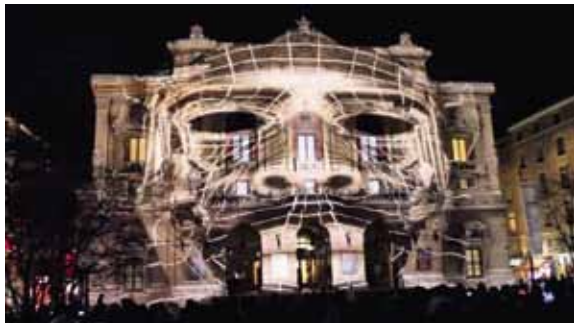
Иллюстрация 1. Видеомэппинг на фасаде исторического здания театра в Лионе, Франция.