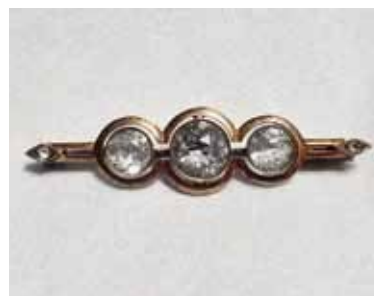
Иллюстрация 3. Брошь. 1958 г. Свердловский завод «Русские самоцветы». Серебро, горный хрусталь, золочение, огранка, закрепка. (Шифр Б-68). Частная коллекция