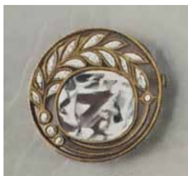
Иллюстрация 4. Рисунок броши Б-85. Из альбома «Русские самоцветы» [13, 76]

жения и предмета позволяет говорить о существующей в производстве вариативности использования материалов. Так, в отличие от описания приведенной в альбоме броши со вставками из ограненного горного хрусталя, предмет из собрания музея включает более изысканные драгоценные ограненные демантоиды нежно-зеленого оттенка, дополненные в качестве яркого акцента ярким синтетическим корундом.