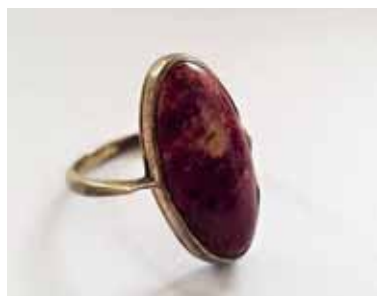
Иллюстрация 1. Кольцо. 1953 г. Свердловский завод «Русские самоцветы». Серебро, яшма, золочение, огранка, закрепка. (Шифр К-3). Частная коллекция