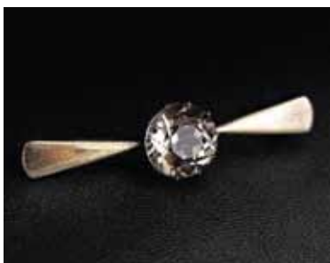
Иллюстрация 2. Брошь. 1958 г. Свердловский завод «Русские самоцветы». Серебро, дымчатый кварц, огранка, закрепка. (Шифр Б-27). Частная коллекция