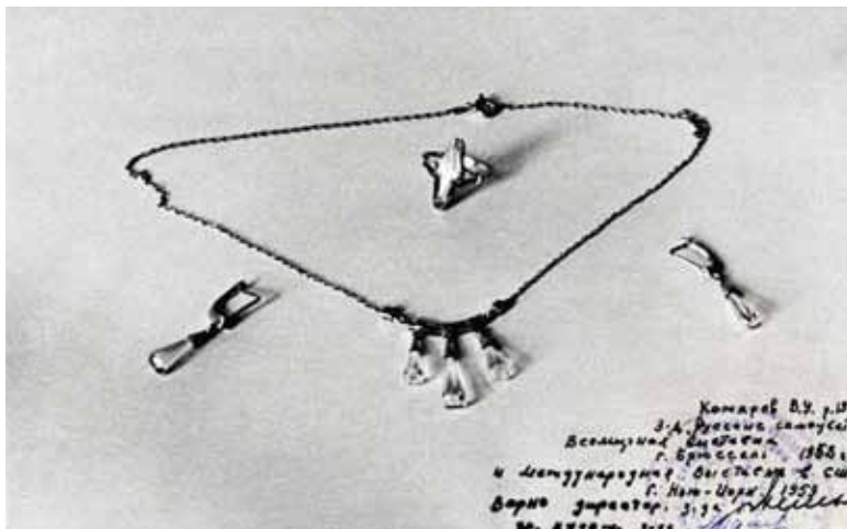
Иллюстрация 6. Фотография гарнитура В. У. Комарова. 1958 г. Музей истории камнерезного и ювелирного искусства.

[10, 47]. Тем не менее И. М. Шакинко и В. Б. Семенов указывают, что вместе с камнерезными предметами были представлены и ювелирные изделия завода, и приводят цитату из диплома «...за ювелирные изделия и ларцы из малахита» (без указания источника) [16, 224].