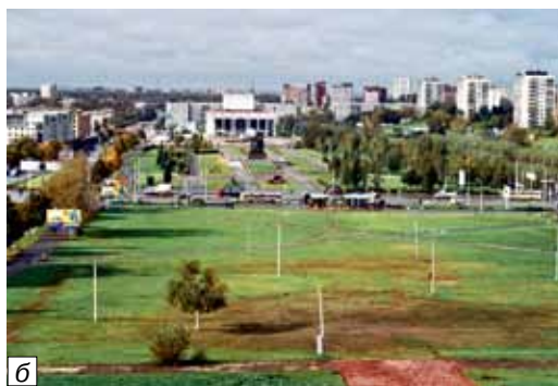
Иллюстрация 1: а — панорама Перми, ул. Коммунистическая. Фото 1972–1974 гг. (Ф. Оп. 61п. Д. 04547). Источник: Государственный архив Пермского края, http://www.archive.perm.ru/upload/medialibrary/6aa/ff.op.61p.d.04547.panorama-g.permi.ulitsa-kommunisticheskaya.jpg ; б — эспланада. Фото А. Полудница. 2012 г., https://senat-perm.livejournal.com/692157.html

Современный город представляет собой сложноорганизованную пространственную урбанизированную среду, а также является сложноподчиненной системой, объединяющей территории различного назначения и коммуникационные элементы. В мировой практике реализованы разноплановые решения центральных городских открытых территорий. Однако в мире насчитывается не более десятка городов с приемом организации городского пространства, аналогичным пермской эспланаде. Как показало время, решение о размещении и обустройстве большой открытой досуговой территории в центре города востребовано и на текущий момент.